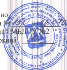
График проведения инструктажей по пожарной безопасности.