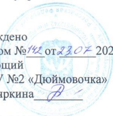
График работы специалистов консультативного пункта на 2021- 2022 учебный год.