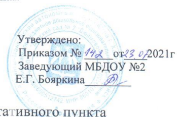
График работы специалистов консультативного пункта на 2021-2022г.